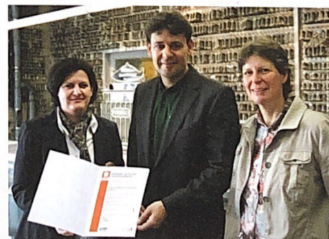
2011 wurde der Münchner Schlüsseldienst vom HBE mit dem Zertifikat „Generationenfreundliches Einkaufen“ ausgezeichnet.